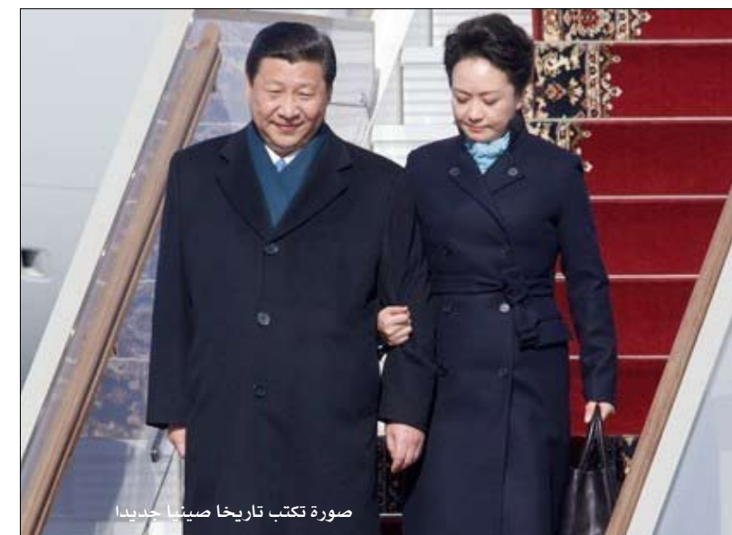
صورة تكتب تاريخا صينيا حديدا