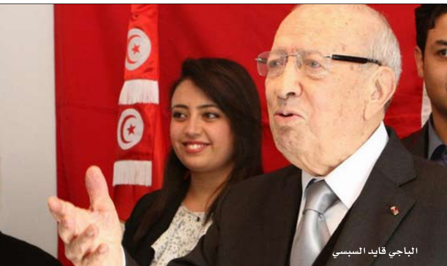
الباجي قايد السبسي

فيما بنا صرنا نثير مسائل من قبيل هل المرأة مكتملة للرجل أم لا وغير ذلك من المواضيع الجانبية والهامشية. ورأى قائد السبسي أن من بيدهم الحكم اليوم ليست لديهم رؤية واضحة، إلى أين نضفي اليوم فهم يسيرون البلاد بطرق غير محكمة والوضع الاقتصادي أصبح سيئا جدا وصرنا على مشارف نكبة كبرى إذا ما لجأنا إلى صندوق النقد الدولي مضيضا نأمل أن نستفيد هذه الحكومة من أخطاء الحكومة السابقة ونتمنى لها النجاح، وأضاف قائد السبسي يلزمنا وقت طويل وتونس بلد صغير لا يمكن أن يعيش إلا مفتحا على الخارج وخصوصا محيطه الأوروبي.