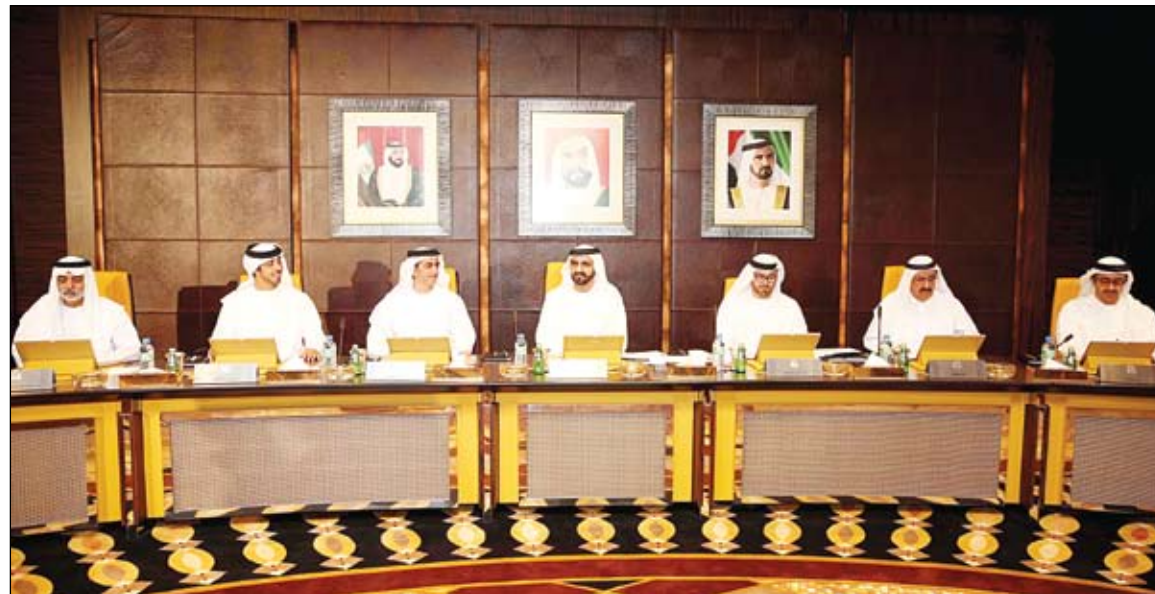
محمد بن راشد خلال ترؤسه اجتماع مجلس الوزراء (وام)

أكد صاحب السمو الشيخ محمد بن راشد آل مكتوم نائب رئيس الدولة رئيس مجلس الوزراء حاكم دبي أن تجديد ثقة صاحب السمو الشيخ خليفة بن زايد آل نهيان رئيس الدولة بالحكومة يفرض علينا مضاعفة الجهود للتعامل مع ملفات وطنية مهمة وأولويات تنموية واجتماعية رئيسية وتحقيق تطورات المواطنين في العيش الكريم. جاء ذلك خلال ترؤس سموه لجلسة مجلس الوزراء الأولى بعد التشكيل الجديد والتي عقدت صباح امس بقصر الرئاسة وذلك بحضور الفريق سمو الشيخ سيف بن زايد آل نهيان نائب رئيس مجلس الوزراء وزير الداخلية وسمو الشيخ منصور بن زايد آل نهيان نائب رئيس مجلس الوزراء وزير شؤون الرئاسة. ورحب صاحب السمو الشيخ محمد بن راشد آل مكتوم بالوزراء الجديد وخطب الجميع مؤكدا أن التوقعات عالية والثقة بكم كبيرة والأولويات واضحة وشعب الإمارات يستحق الأفضل ووجه سموه الجميع بالعمل بروح الفريق الواحد وبأن يكون تطوير الخدمات المقدمة للمواطنين هي الأولوية رقم واحد في جدول أعمالهم وأجندات وزاراتهم وهيئاتهم حيث قال سموه نعمل بروح الفريق الواحد تحت رؤية واحدة ورئيس واحد.. وتطوير الخدمات المقدمة للمواطنين هي الأولوية رقم واحد.